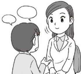
おはなしをしたいとき