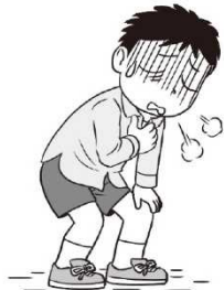
ぐあいがわるいとき