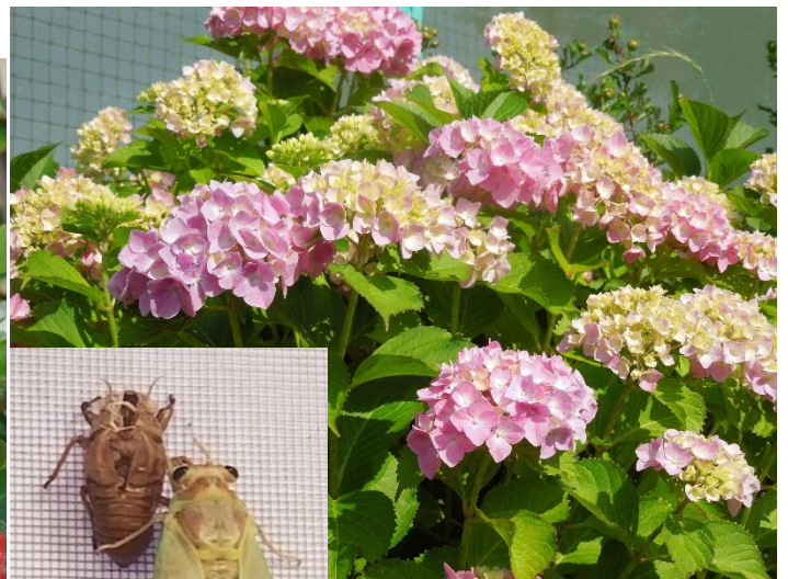
□校内で羽化したばかりのセミ