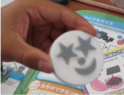
□3年おもちゃリサイクル学習 (7月)