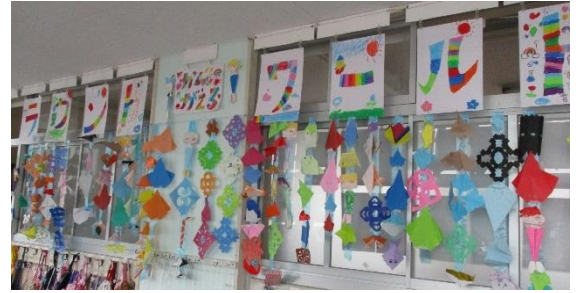
□天神フェス 廊下も賑やかになりました。