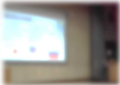
原爆の子の像について