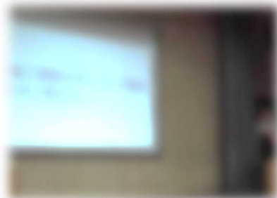
非核三原則について