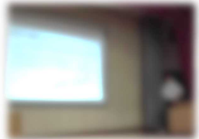
戦争中の障がい者支援について