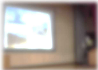
長崎平和公園について