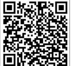
秋葉台中学校 欠席連絡

すでに利用されているご家庭もありますが、改めて「欠席連絡フォーム」についてお知らせいたします。体調不良やご家庭のご用事でお休みをする場合に右にあります QR コードを読み込み、中学校へ欠席連絡をすることができます。中学校の電話回線が混み合い、つながらないことも考えられますので、ご活用ください。また、通院等でやむを得ず遅刻にする場合などにも活用することができます。