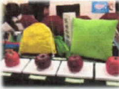
2年生歌のテスト 3年生から熱い アドバイスが...