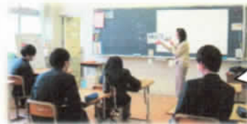
先生の読み聞かせ 「しょうたとなつとう」